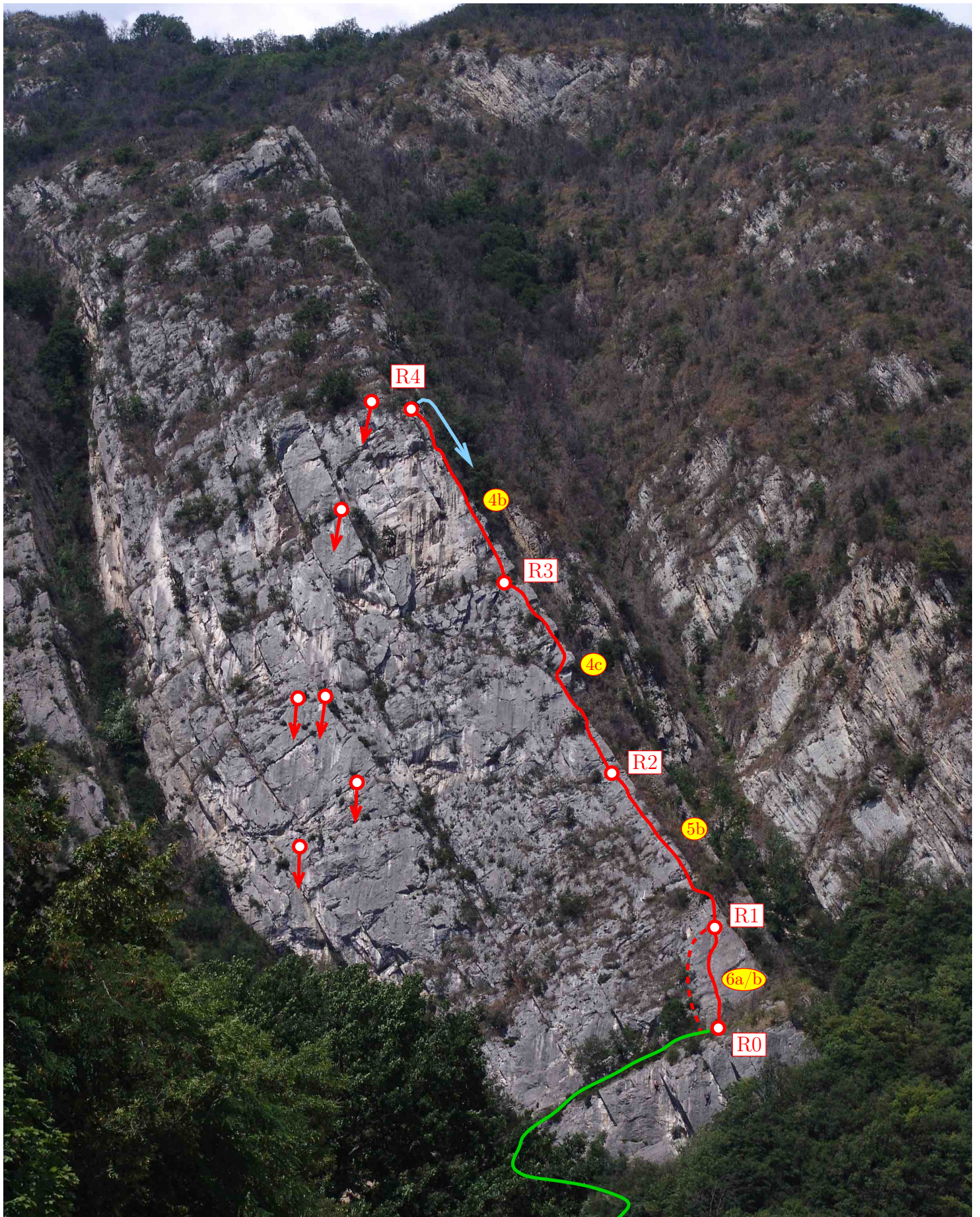
Saint-Égrève – Éperon des Gosses Mythiques – Topo L1 : départ facile en pointillé ; Dondorgane (6ab) en continu (Photo prise le 9 juillet 2005)