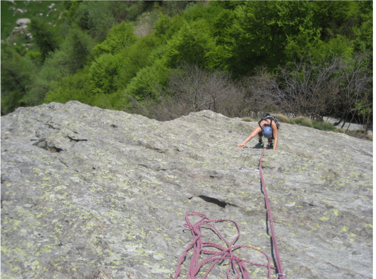
Dalles d'Auriane (secteur gauche) – Spirito Divino – L4 (4b), à moins que ce ne soit L3...