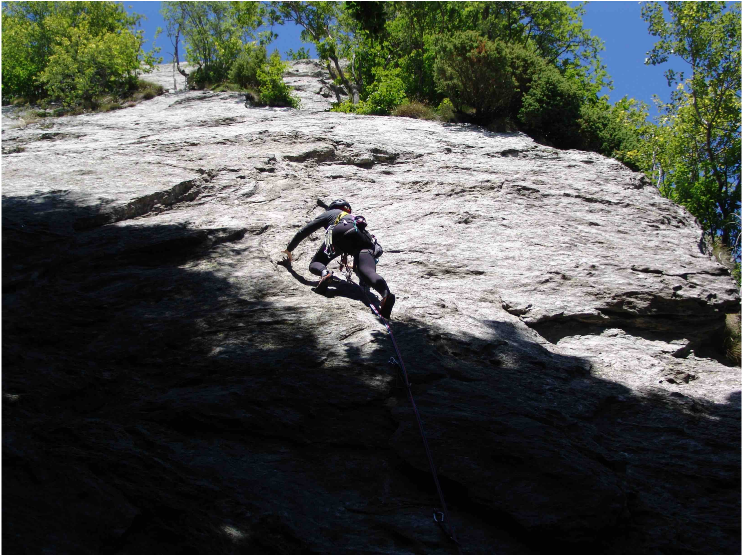
Dalles d'Auriane (secteur gauche) – Spirito Divino – Une panthère noire sort de l'ombre pour faire la L1 (5b) (Photo prise le 14 juillet 2021)