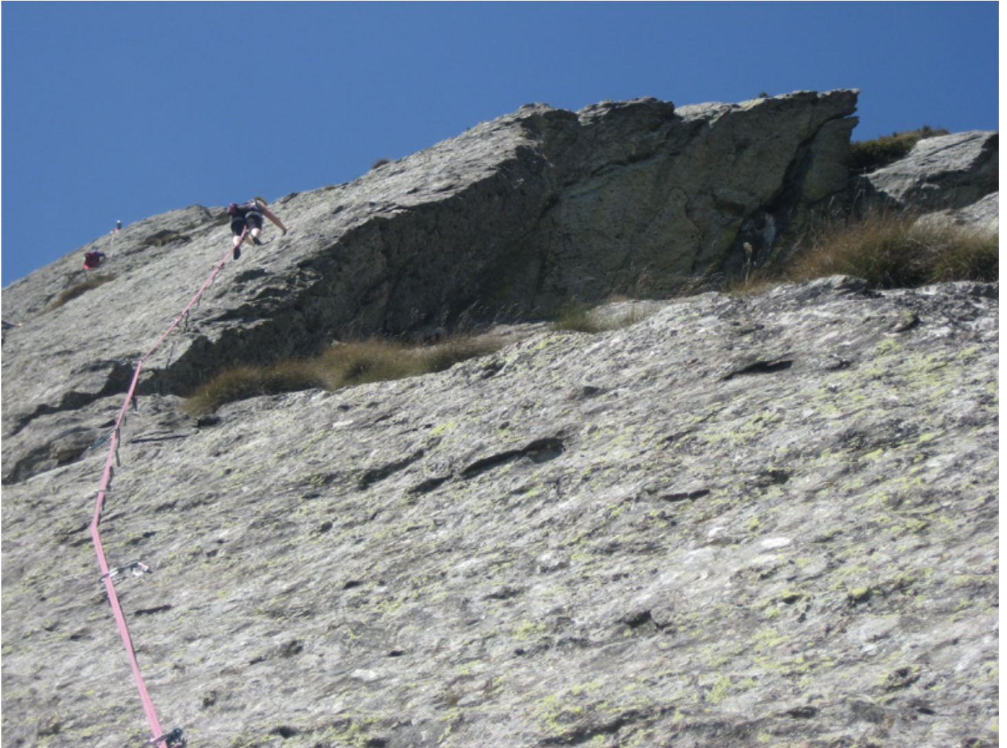
Dalles d'Auriane (secteur gauche) – Spirito Divino – L5 (4b), à moins que ce ne soit L4...