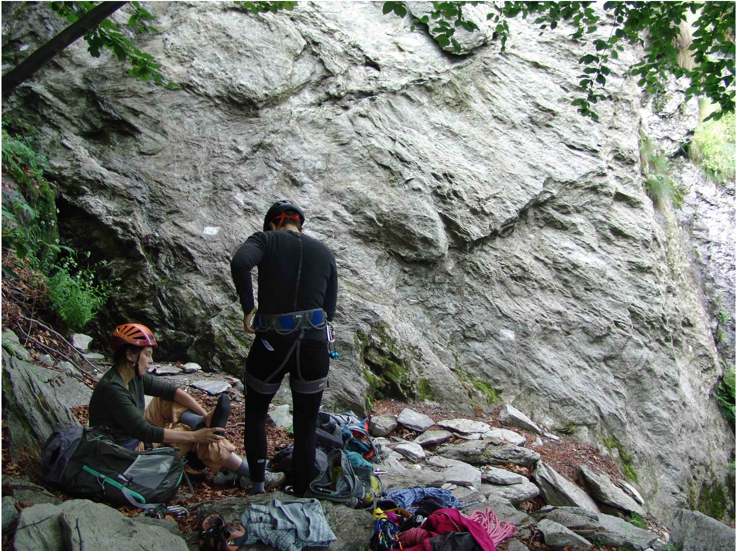
Dalles d'Auriane (secteur gauche) – Spirito Divino – Le nom de la voie est inscrit au départ, dans le rectangle blanc à droite des grimpeuses (Photo prise le 14 juillet 2021)