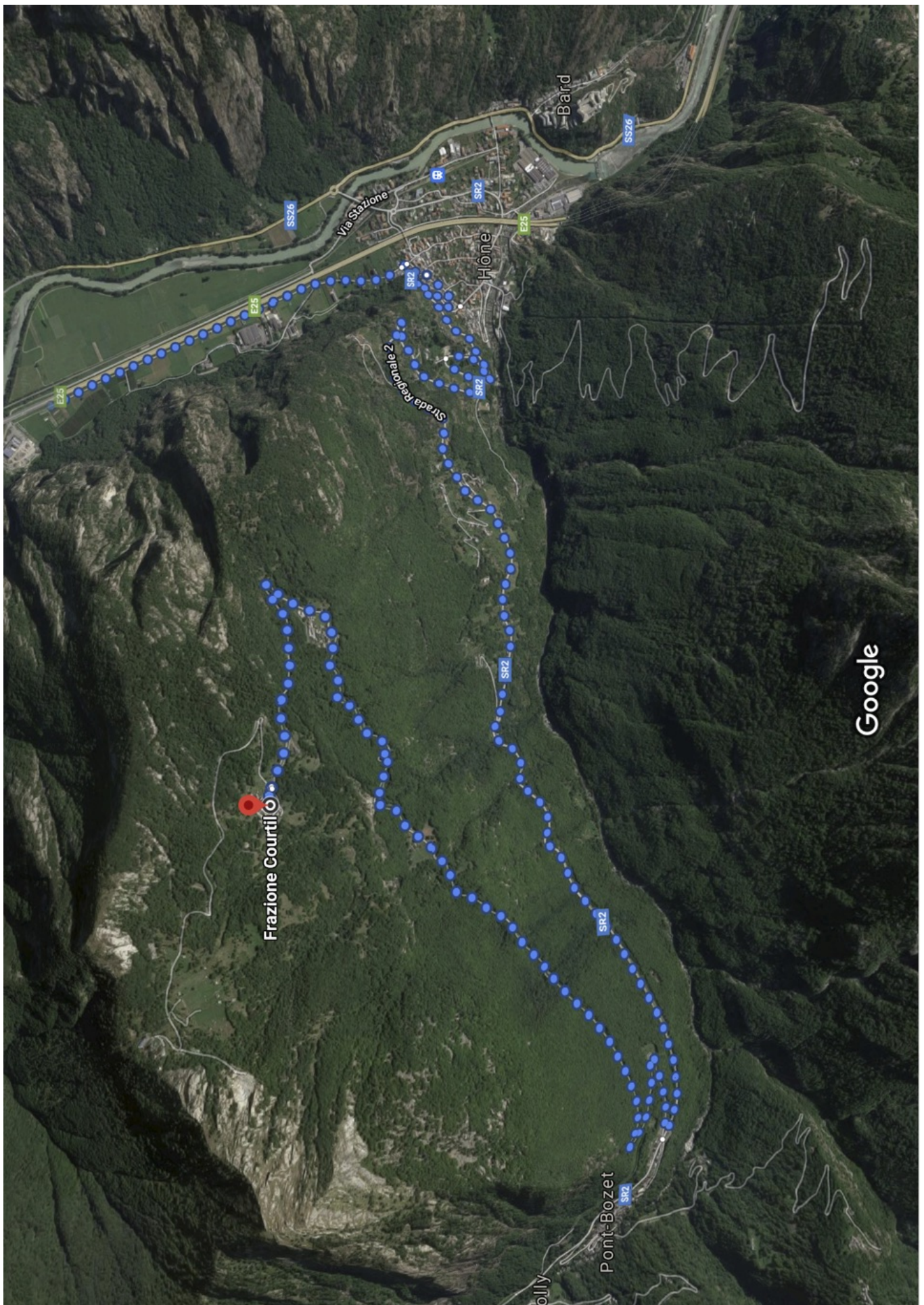
Accès routier : Montée à Courtil