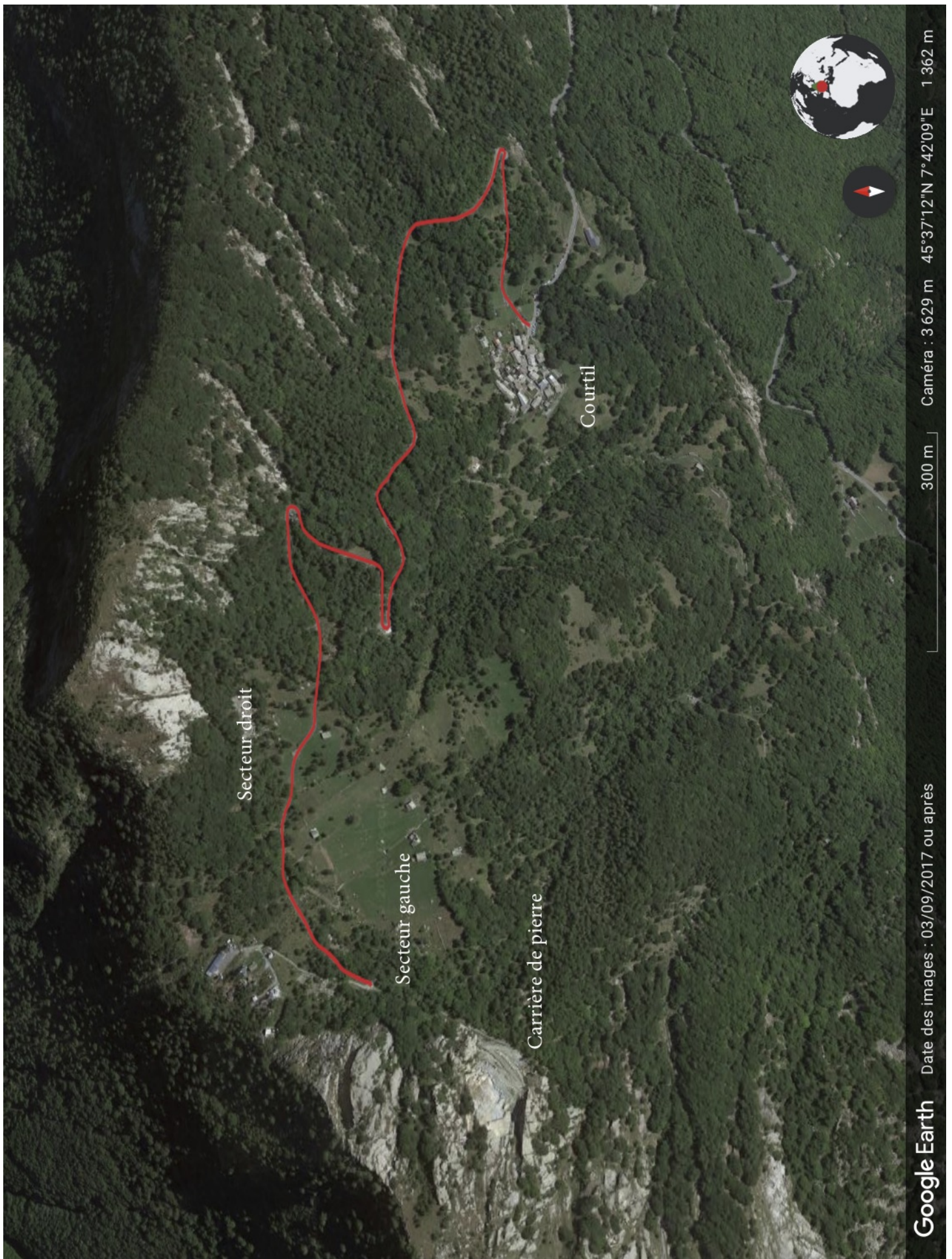
Les secteurs de Courtil et route carrossable à prendre à pied (Google earth)